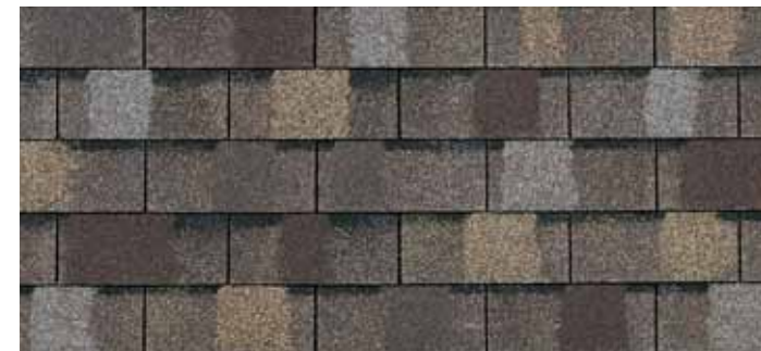
• Sienna Blend