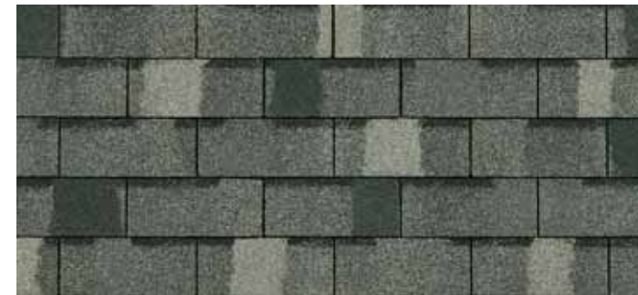
• Estate Grey