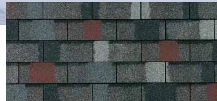
• Colonial Slate

Подтверждено, что вся черепица Owens Corning соответствует или превосходит существующие стандарты пожаростойкости и ветростойкости.