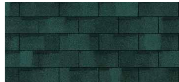
• Chateau Green